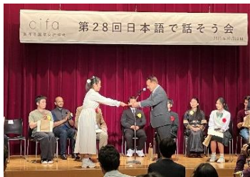
第28回日本語で話そう会