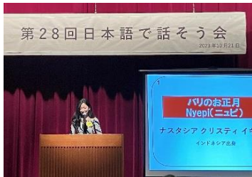
第28回日本語で話そう会